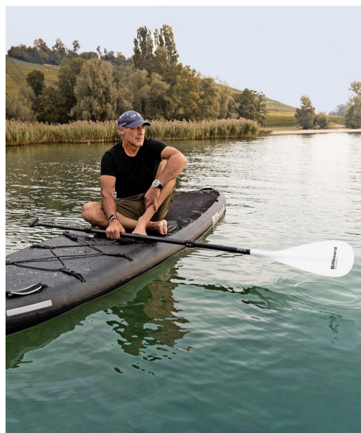
Mike Horn incarne les activités en plein air dans les paysages naturels suisses, comme ici sur le lac de Neuchâtel.

Pour y parvenir, cinq vidéos ont été réalisées et sont réunies sur un minisite créé pour l'occasion. Dans l'une d'elles, l'aventurier se promène dans le canton de Vaud. Sur les pentes du vignoble de Lavaux, Mike Horn nous apprend qu'en arrivant en Suisse, c'est ici qu'il a participé à ses premières vendanges. Féru de voile, il part en-