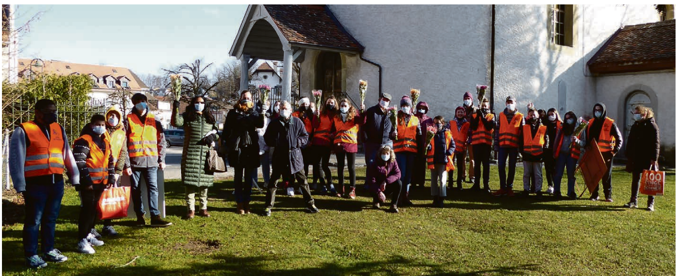
Les catéchumènes vous proposent des roses.