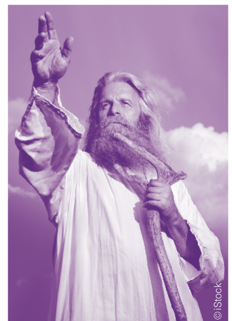
Les stéréotypes influencent-ils l'image que nous nous faisons de Dieu ?

En psychologie expérimentale, il est établi qu'une forme grammaticale masculine, telle qu'utilisée pour décrire Dieu depuis des siècles, génère des interprétations masculines, et non neutres ou féminines. Mais comment la construction d'un imaginaire de Dieu, imprégné par la culture, la société et l'époque, influe-t-elle sur une relation spirituelle, intime et individuelle ? Peut-on mettre en rapport les droits de personnes ou de minorités avec le genre divin ? Ces questions restent débattues. Camille Andres, avec M. W.