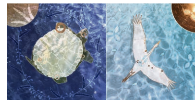
Along the River of Spacetime (Le Long de la rivière de l'espace-temps) par Elizabeth LaPensée, 2019.