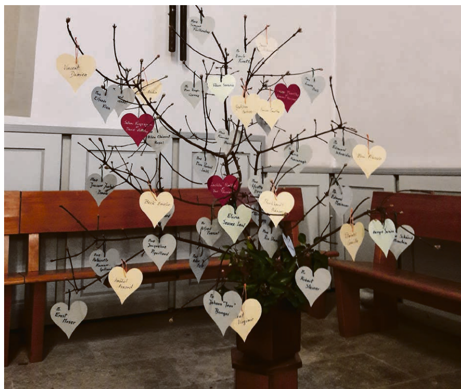
Se souvenir avec cœur de chaque personne ayant vécu un événement particulier en paroisse en 2021.