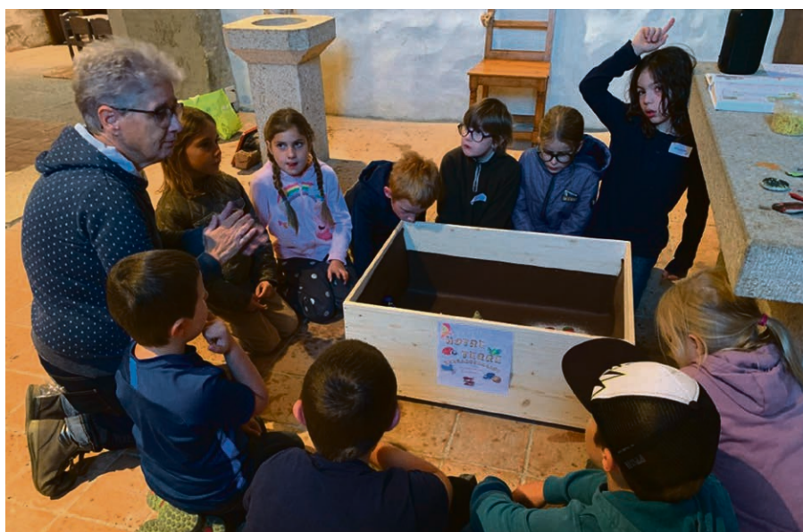
Le récit de la manne.