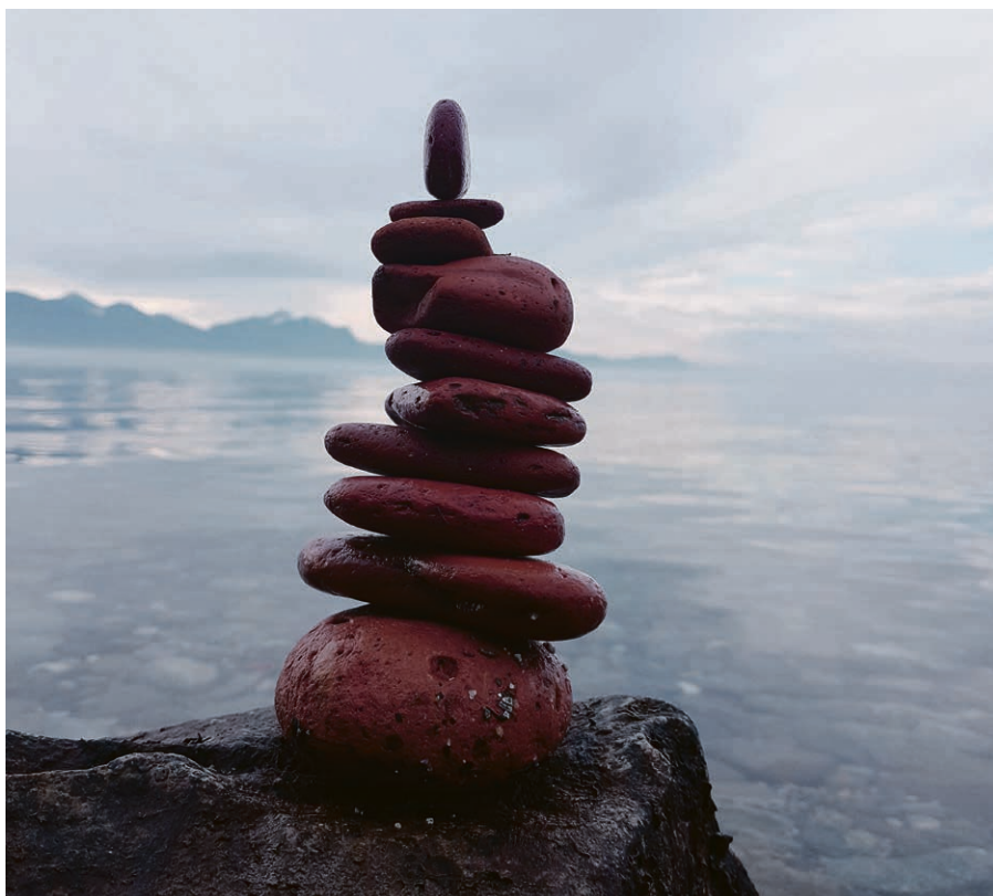
Recherche d'équilibre, paix intérieure.

Dans les villages de Chavannes et d'Hermenches, le Culte de l'enfance a lieu les vendredis après l'école, pour les enfants