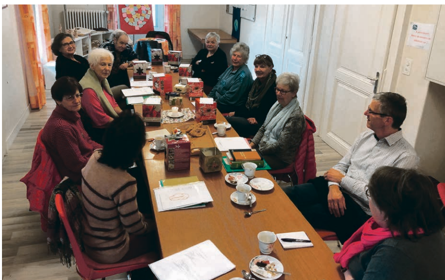
Groupe de visiteuses et visiteurs.