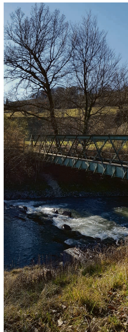
La Broye d'une rive à l'autre.

mettra de corriger ce qui doit l'être. Bien sûr, comme tout changement, cette réorganisation peut engendrer des inquiétudes ; mais le conseil régional compte sur la collaboration de tous pour susciter de nouvelles dynamiques efficaces et rationnelles. ▲ Florence Clerc Aegerter, coordinatrice de la Région La Broye