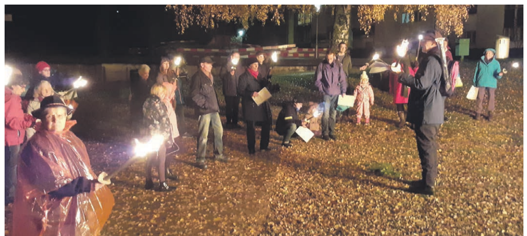
Souvenir du feu de l'Avent 2019 aux Marines.

Calendrier de l'Avent en ligne Chaque jour un message ou une prière, une photo, et un concours par semaine à qui saura reconnaître où a été prise la photo d'un détail. Nous restons sur le territoire paroissial et vous pouvez envoyer vos suggestions de livre bien aimé, vos photos, etc www.villeneuvehautlac.eerv.ch