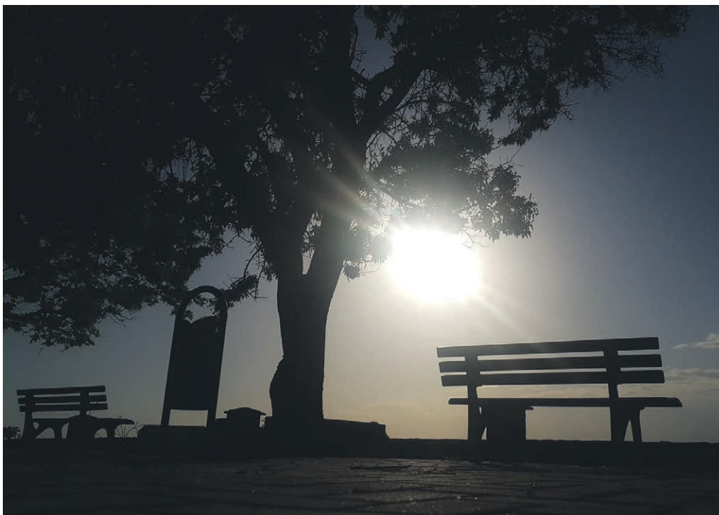
Une lumière dans la nuit qui tient les hommes debout.

Mais voici que l'histoire du peuple des croyants est habitée de femmes, d'hommes et d'enfants qui ont été remis debout, debout pour dire aux autres : « Confiance, relevez-vous. Un avenir est encore ouvert devant vous : une lumière brille dans la nuit. » A nous de nous laisser éclairer et de rappeler ces mots d'Irénée de Lyon au III e siècle : la gloire de Dieu, ce sont les humains debout !