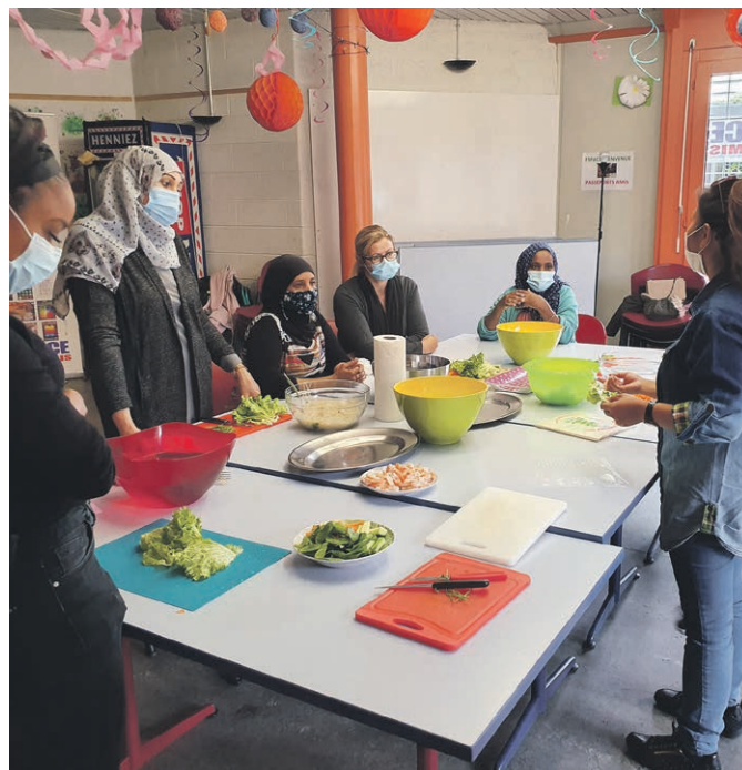
Cuisine indonésienne à l'Espace Bienvenue.