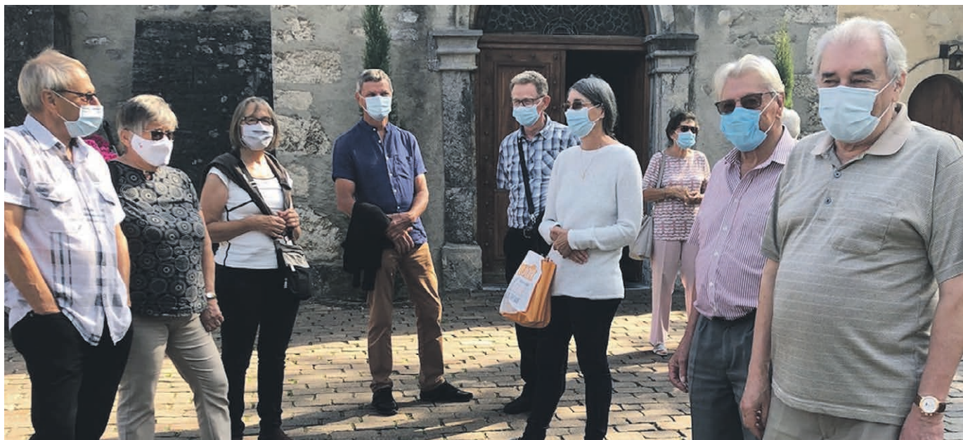
sortie d'un culte d'automne.