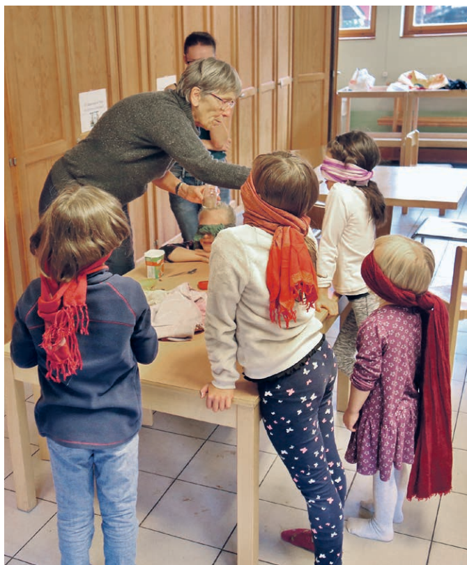
Atelier des explorateurs octobre 2020.