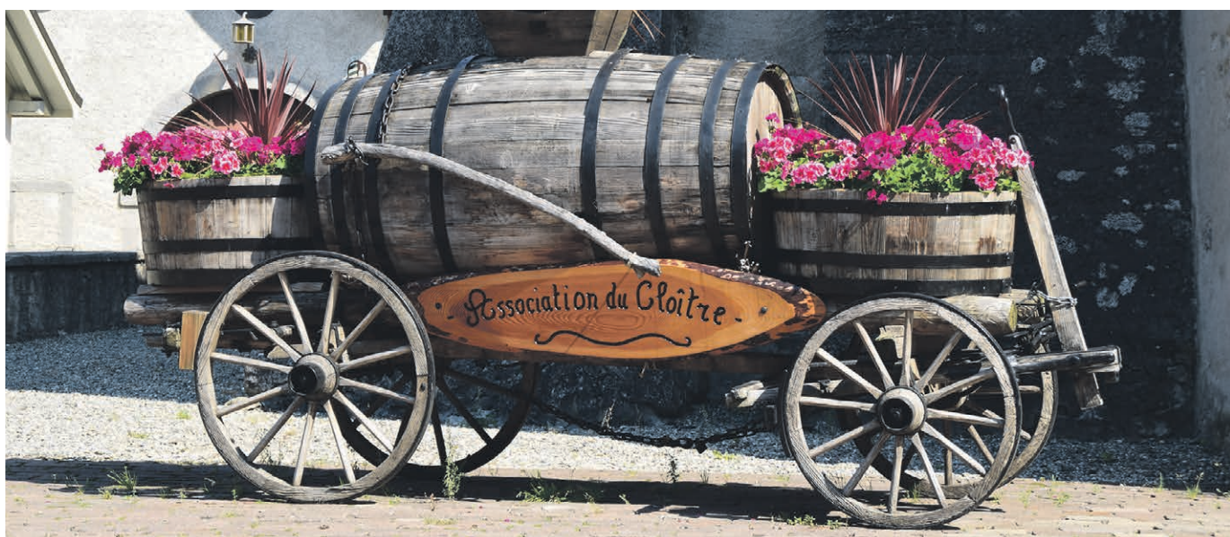
Eglise du Cloître, Aigle.