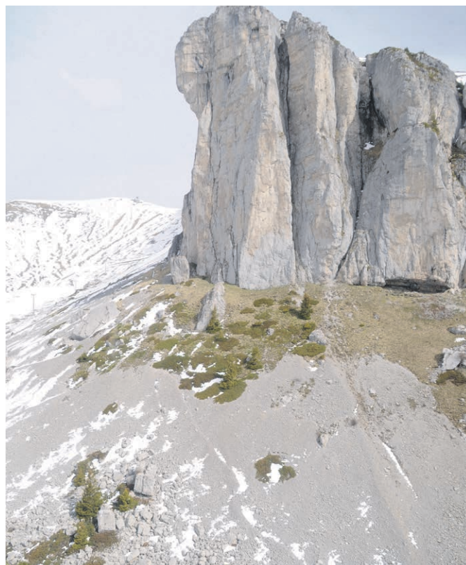
Les parois vertigineuses de Leysin.