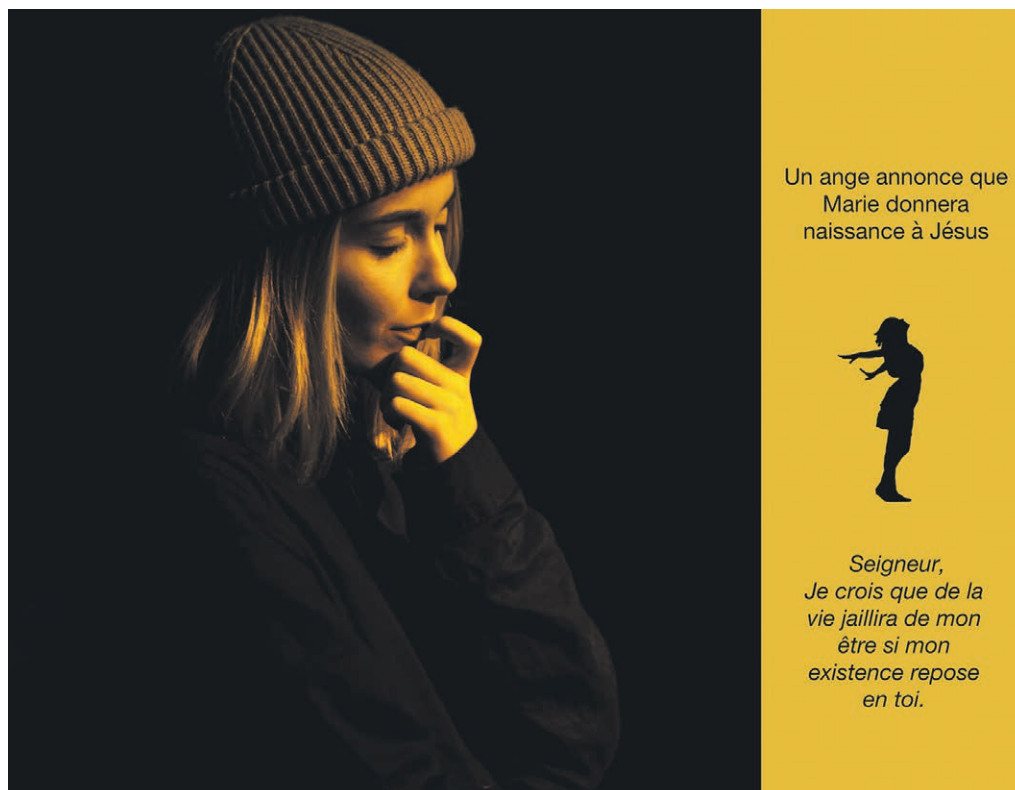
Carte postale spirituelle: une naissance malgré tout.