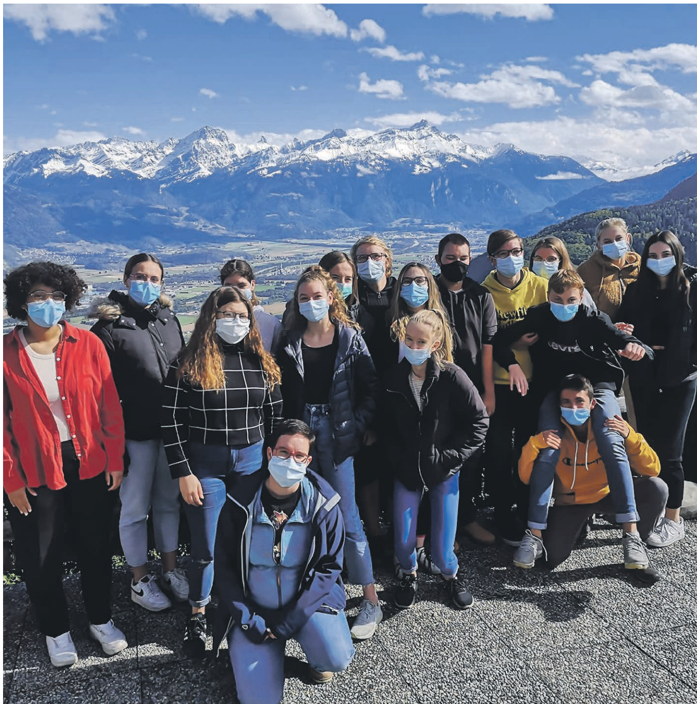
Les jeunes confirmants à Torgon.

contre le Covid, mais ceux qui cachent notre vrai visage, qu'ils soient imposés par les autres ou qu'ils viennent de nous-mêmes. L'équipe des jeunes a été enchantée par ce moment vécu et se réjouit d'en vivre d'autres ! Le prochain Célé'jeunes aura lieu le 7 février à Leysin (mais tout reste à confirmer, évidemment).