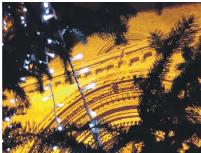
Noël dans un village en Catalogne, Agramunt.

Rends-moi flexible face aux nouveaux gestes que l'on attend de moi.