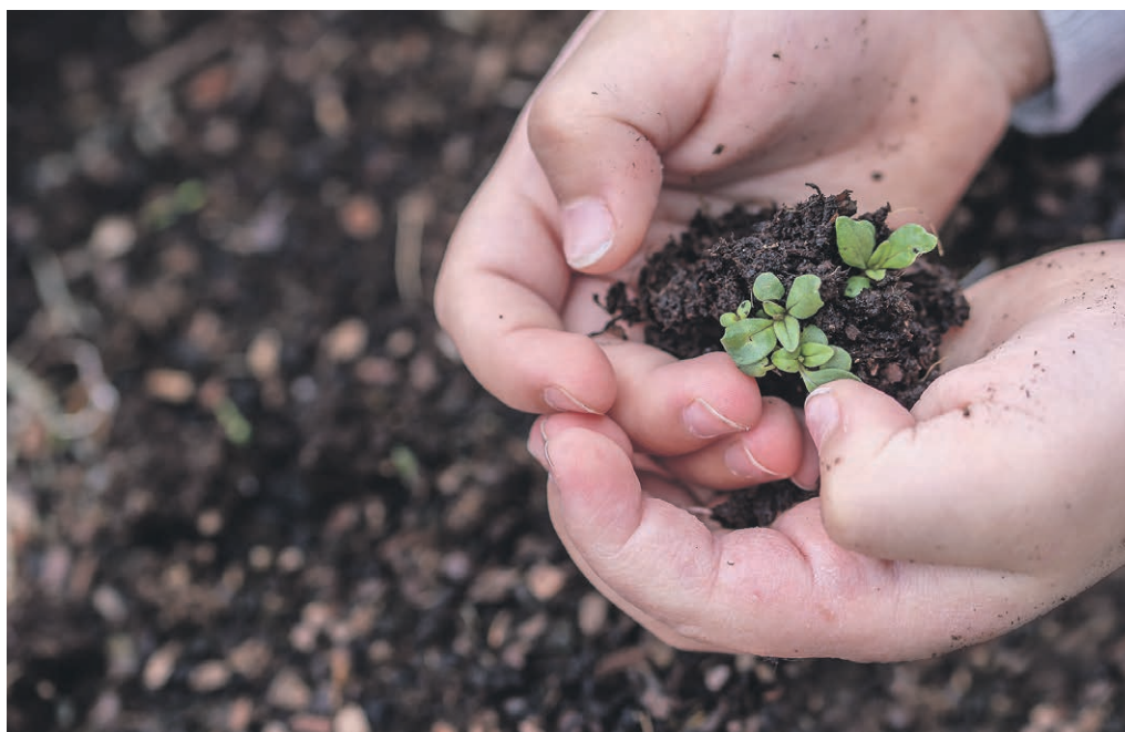
Croi(T)re ensemble