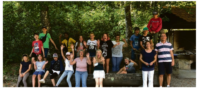
Rencontre de reprise des KT 7-8 - Refuge de Champvent, le 12.09.2020.