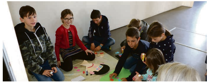
Culte des récoltes du 4 octobre 2020.

Mini-week-end les 30 et 31 octobre puis rencontres les 4, 11,