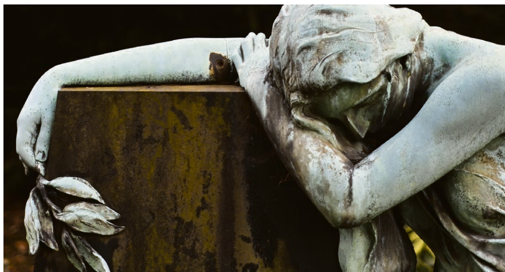
Faire son deuil.

Dans un service, le nom du défunt est rappelé. D'une certaine manière, il contient toute une vie avec ce qui a été et ce qui n'a pas été, les liens qui nous unissent. Chacun a connu une partie seulement de l'autre. Personne ne connaît l'image complète. Seules des bribes d'une vie sont partagées mais, souvent, elles nous ont enrichis. Nous ne serions pas qui nous sommes sans elles. Et reconnaître ce qui a