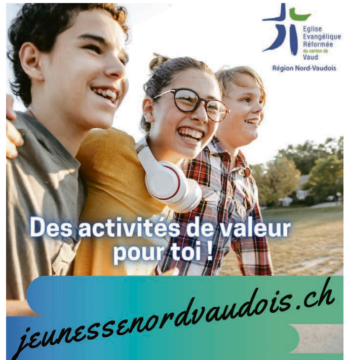
Activités Jeunesse 2020-2021.

Ici comme ailleurs, Noël approche. Nous pouvons, cette année à nouveau, faire une place dans nos cœurs aux enfants et adultes défavorisés des pays de l'Est. Pour des raisons de douane, les paquets doivent être identiques. Vous pouvez participer à cette action en déposant à la salle de paroisse de Champagne la marchandise