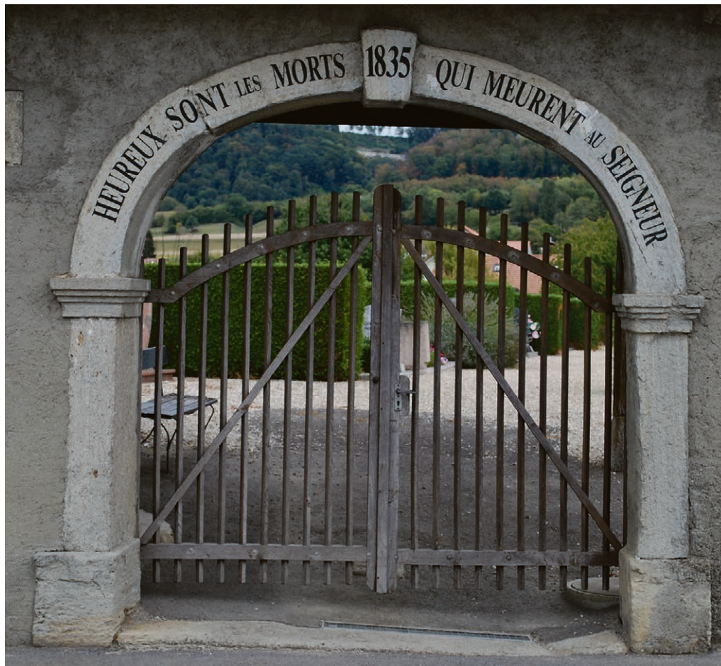
Cimetière.